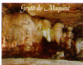
Grotto do Maquine