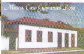
Museu Casa Guimarães Rosa

"O correr da vida embrulha tudo. A vida é assim, esquentada e esfria, aberta e afrouxa e depois desinquieta. O que ela quer da gente é coragem".