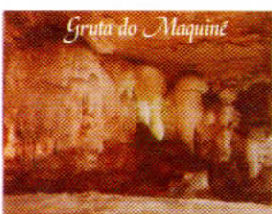
Gruta do Maquiné