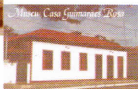
Museu Casa Guimarães Rosa

"O correr da vida embrulha tudo. A vida é assim, esquentada e esfria, aperta e afrouxa e depois desinquieta. O que ela quer da gente é coragem".