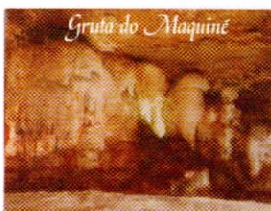
Grotto of Maquiné