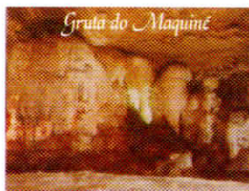
Gruta do Maquié