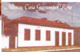
Museu Casa Guimarães Rosa

"O correr da vida embrulha tudo. A vida é assim, esquentada e esfria, aberta e afrouxa e depois desinquieta. O que ela quer da gente é coragem".