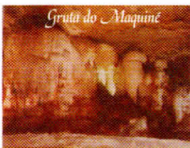
Gruta do Máquina