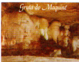
Grotto of Maquinetur