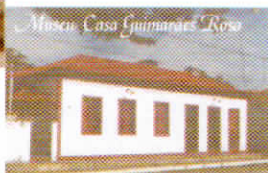
Museum Casa Guimarães Rosa

"O correr da vida embrulha tudo. A vida é assim, esquentada e esfria, aberta e afrouxa e depois desinquietada. O que ela quer da gente é coragem".