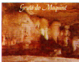
Gruta do Máquina