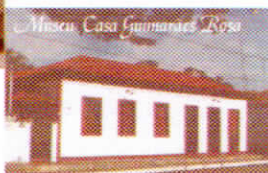
Museu Casa Guimarães Rosa

"O correr da vida embrulha tudo. A vida é assim, esquentada e esfria, aberta e afrouxa e depois desinquieta. O que ela quer da gente é coragem".